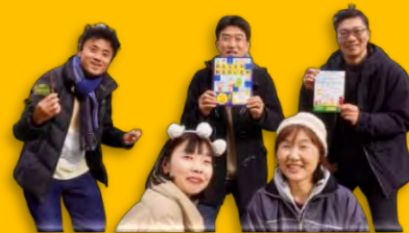
ブックブックこんにちは